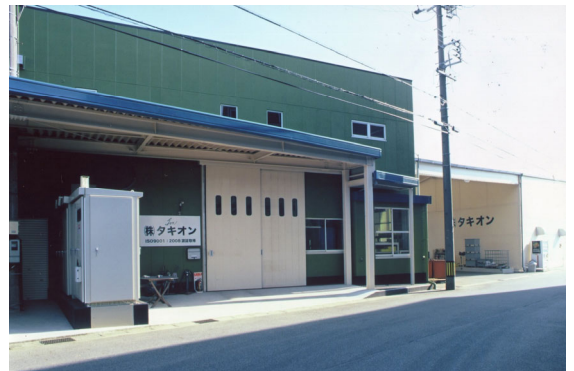
愛知県安城市にある本社工場

株式会社タキオンは、自動車部品の試作専門メーカーです。1979年に設立されて今年43年目を迎え、現在従業員は20名。「試作開発を全力で支援する会社」として、自動車部品メーカーの依頼に応じて設計から金型製造、試作までを短期間で行うことを強みとしています。なお、社名の「タキオン」は、超光速で動くと仮定されている粒子に由来しています。社名の通りのスピーディな試作対応で、顧客の「試作品をすぐに評価したい」というニーズに応えてきました。