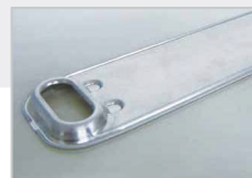
プレートクーリング