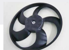
シュラウドファン