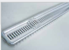
多機能コアプレート

多能工化など独自の一貫生産体制を持ち、納期対応に厳しさのある試作・開発関連などの局所的な短納期案件に対応。