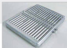
水冷CACコアプレート